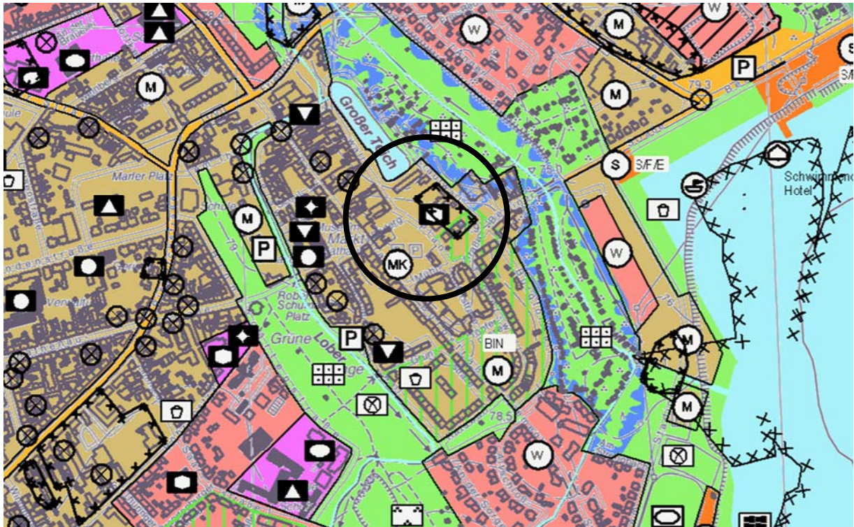
rechtskräftiger Flächennutzungsplan der Stadt Bitterfeld-Wolfen (Auszug)

Grundlage: Genehmigungsfassung 05/2012, M 1: 10.000