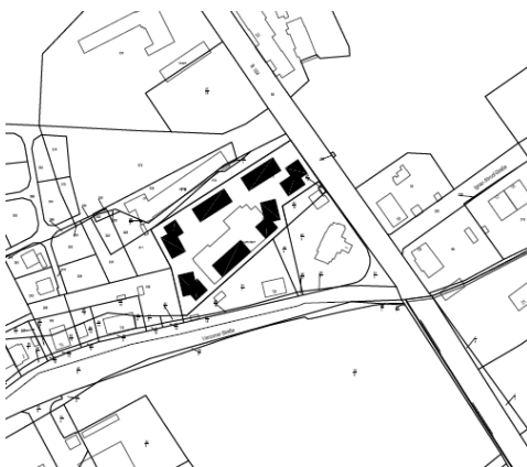
Nahversorgungslage Leipziger Straße Gemarkung Bitterfeld Flurstück 272 der Flur 46