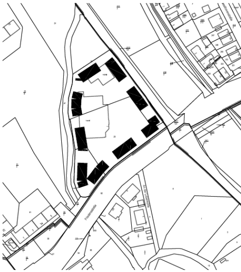
Nahversorgungslage Friedensstraße Gemarkung Bitterfeld Flurstücke 25, 26 und 27 der Flur 18