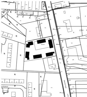
Nahversorgungslage Steinfurter Straße Gemarkung Wolfen Flurstück 1707 (anteilig) der Flur 27