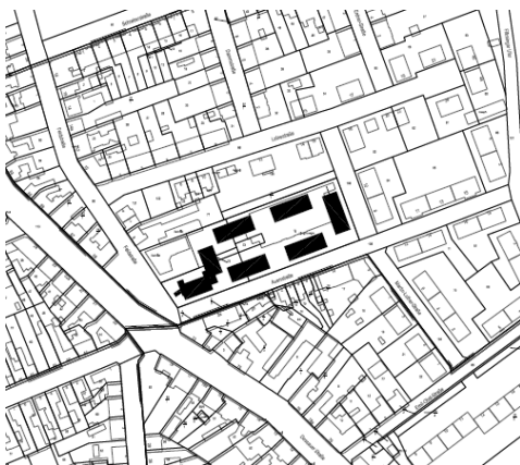
Nahversorgungslage Auenstraße Gemarkung Bitterfeld Flurstück 72, 73, 74 und 75 sowie 76 (anteilig) der Flur 17